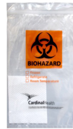
1. Bolsas para materiales de riesgo biológico y hojas absorbentes (3)