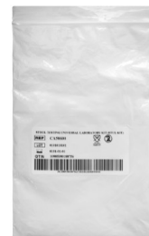
6. Bolsa blanca del kit