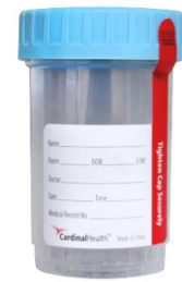
2. Recipiente estéril azul